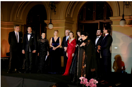
Governorul BNR și sopra Mariana Nicolesco, în mijlocul performerilor

București, Sala de Marmură a Băncii Centrale. Un ambient în care au devenit tradiționale concertele realizate de marea soprană Mariana Nicolesco, în compania unor laureați ai Concursului Internațional de Canto „Hariclea Darclée”. În preajma Sărbătorilor Pascale, evenimentul a sărbătorit aniversarea înființării primei instituții bancare a țării și s-a desfășurat în prezența Guvernatorului Mugur Isărescu, a membrilor Consiliului de Administrație, a unui numeros și entuziast public.